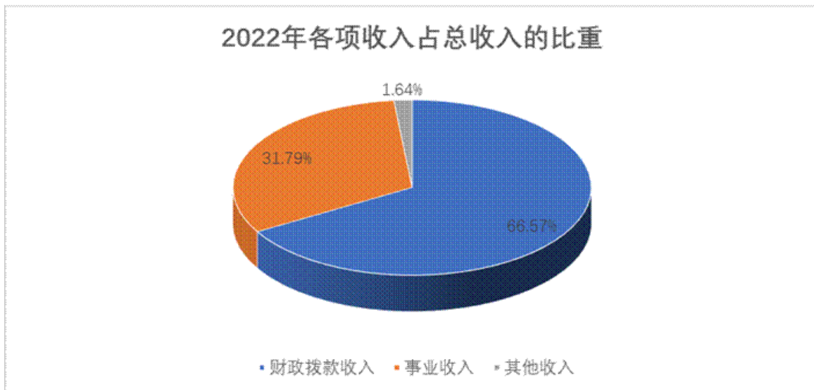
图 3.1 2022 年各项收入占总收入的比重